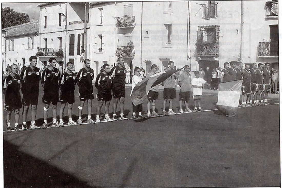
Le week-end s'est achevé dimanche soir à Gignac par le match entre les équipes A des deux pays.