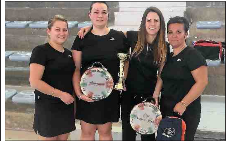
■ Les Londraines n'ont pas démerité mais ont dû s'incliner.

Après avoir effectué un parcours sans faute lors du championnat, avec dix victoires en autant de rencontres, les filles du Tambourin club londonien se sont qualifiées pour la finale du championnat de l'Hérault en salle.